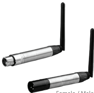
Female / Male

ВНИМАНИЕ! Для организации канала передачи DMX сигнала необходимо наличие двух приемопередатчиков (приобретаются раздельно). Выполняемые функции от типа XLR разъема не зависят.