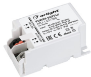
ARJ-LE57350 ARJ-LE71350 ARJ-LE40500