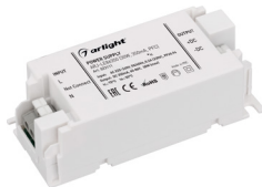
ARJ-LE50500A ARJ-LE29700 ARJ-LE35700