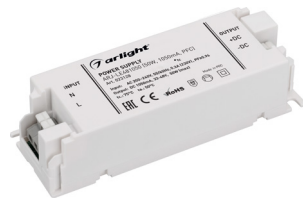
ARJ-LE86350 ARJ-LE100350 ARJ-LE114350