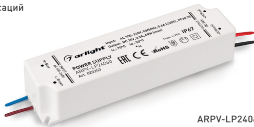
ARPV-LP24060-PFC ARPV-LP24100-PFC ARPV-LP24150-PFC