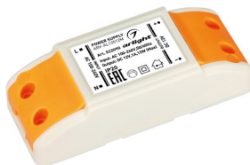
ARV-AL12012M ARV-AL24012M ARV-AL12024 ARV-AL24024 ARV-AL12036 ARV-AL24036