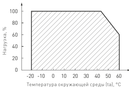
Рис. 2. Максимальная допустимая нагрузка, % от мощности источника.